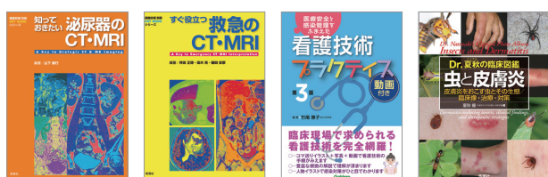
学研メディカル秀潤社