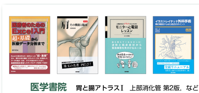
医学書院 胃と腸アトラスI 上部消化管 第2版, など