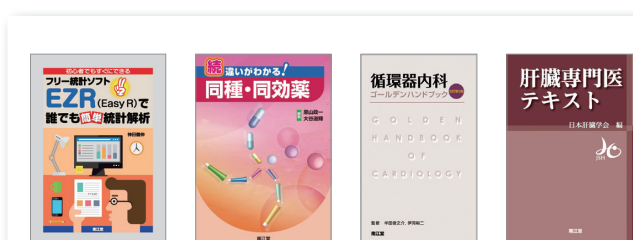
南江堂 消化器内視鏡のコツとアドバイス, など